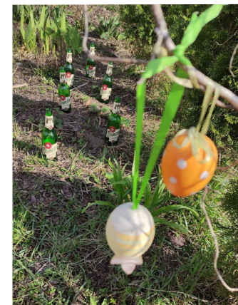
Pravé debrnské pivoňky

Zatím poslední velkou společenskou událostí byla oslava Velikonočního pondělí. Čistě z hlediska počasí považuji tento den za malý zázrak. Předchozí dny nepůsobily dojmem, že si užijeme krásný teplý a slunečný den, který nám vnese do žil trochu té naděje, že ještě někdy dorazí opravdové jaro. Každopádně kolem 9. hod ranní začala jindy klidná obec podezřele ševelit dětskými hlasy. Bylo jasné, že se skupiny malých koledníků začínají scházet, a je tedy nezbytně nutné mít nachystaná malovaná vajíčka, košíky se sladkou nadílkou a něco ostřejšího pro dospělé účastníky. Tatínkové, maminky, kluci i holčičky s pomlázkami se začali brzo trousit, celodenní legrace plná mlsání a smíchu mohla začít! Když se obešly všechny domy a dětské košíky se naplnily po okraj dobrotami, přišel čas na zasloužené společné posezení v naší „Ulici“. Byla by velká škoda nevyužít tohoto povedeného dne až do úplného konce!