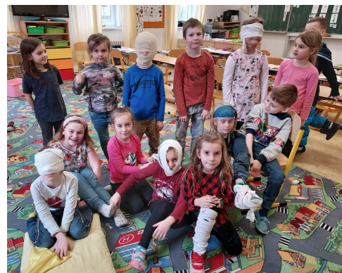
Nácvik první pomoci