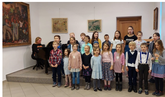
Vystoupení v muzeu