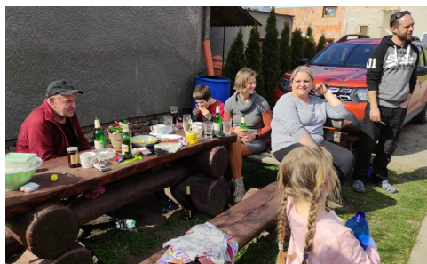
Posezení v Ulici