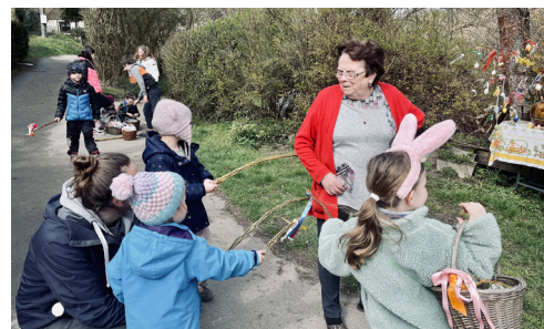
Pomlázka u Kozelků