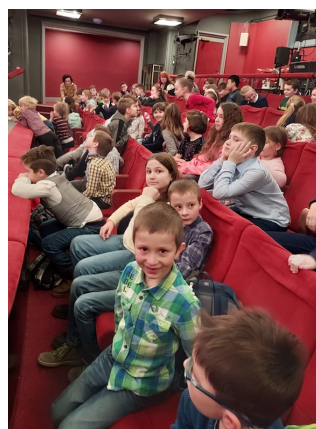
Návštěva divadla v Praze