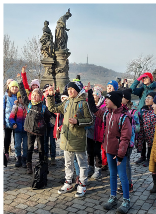
Na Karlově mostě