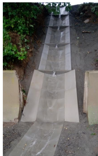
Ing. Tomáš Vlasák

Instalací dálničních panelů podél cesty je taktéž bráněno možnému sesuvu půdy za většího přívalu vody. Je důležité dešťovou vodu zasakovat na svém pozemku a na veřejné prostranství silnice, škarpa, chodník vypouštět jen co nejmenší množství. K tomuto lze využít program Dešťovka a tím, co největší měrou přispět ke stabilizaci podzemních vod.