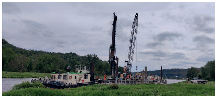
Stavba čekacího stání