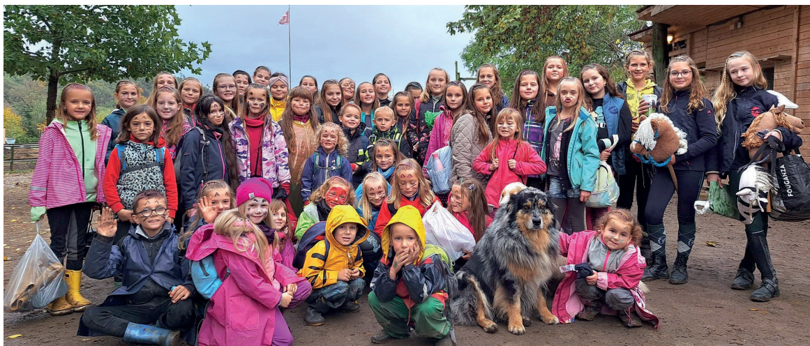
Děti na ranči