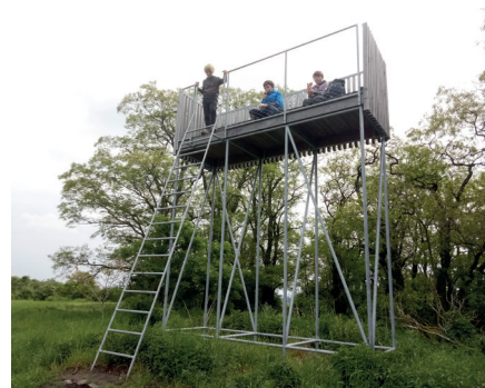
Poseda a pozorovatelná v Libčicích

Jelikož letos připadl na středu volný den, využili jsme toho a uspořádali dvojitou schůzku venku, s pozorováním ptáků. Kromě dalekohledů jsme se vybavili i nahrávkami ptačích hlasů. Ptáci na nahrávky reagovali a díky tomu bylo celé pozorování zajímavější. „Nejupovídanější“ byly sýkory, které reagovaly téměř na každou nahrávku (koňadry, modřinky a jednou parukářka). Podařilo se nám zmást i bažantího kohouta, nebo přivolat pěnkavy. Asi největší radost nám ale udělala káně lesní, která se na nás přiletěla podívat, během svého okruhu nad polem. Cestou k Vltavě nám jako pozorovatelná skvěle posloužila sestava vyhlídkových posedů nad Libčicemi. Spolu se skrivanou se nám ozýval i ůuhák. Na rozloučenou se nám podařilo ještě poplést hlavu konipase bílého, který u naší lavičky marně hledal svého soka. Plánujeme ještě večerní vycházku, tentokrát za soumráknými sovami.