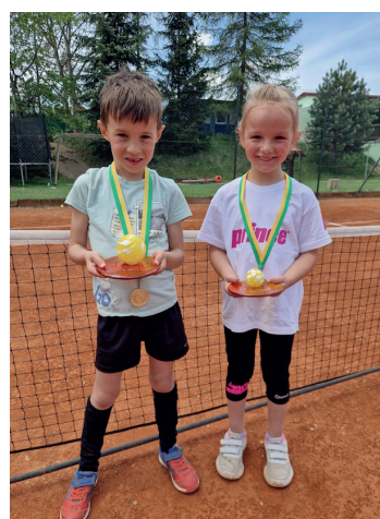
Finalisté turnaje v minitenisu

Celkem pět dětí z dolanské tenisové školy se letos účastní týmových soutěží v mladších věkových kategoriích. Stejně jako vloni jsou to soutěže v kategoriích babytenis (do 9 let) a mladší žáci (10-12 let). Aby toto bylo možné, spojil dolanský tenisový oddíl síly s tím kralupským, a tak letos všech pět dolanských dětí bojuje pod vlajkou TJ Kralupy.