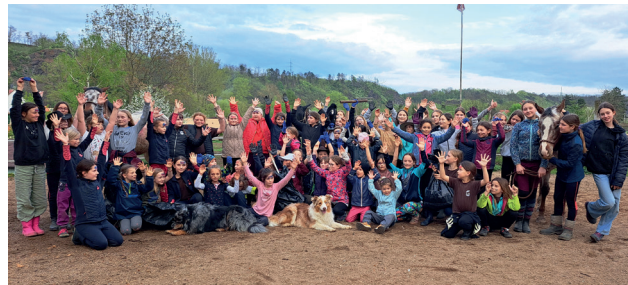
Uklidíme Česko - ranč