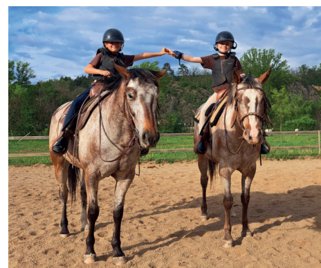
Děti a koně

přírůstky. Klisna Maybe bude maminkou potřetí a zároveň hrdou babičkou díky klisně River, která porodí svého prvního potomka. Těšíme se moc a jsme už, jako na trní, jaká budou mít hříbátka pohlaví a zbarvení. Děti narození hříbátek také velmi prožívají, a tak jsme na ranči umístili schránku, do které děti házejí návrhy jmen a až se hříbátka narodí, tak budou jejich jména vylosována, právě z těch ve schránce. Je vám tedy asi jasné, o čem asi bude článek příští :-).