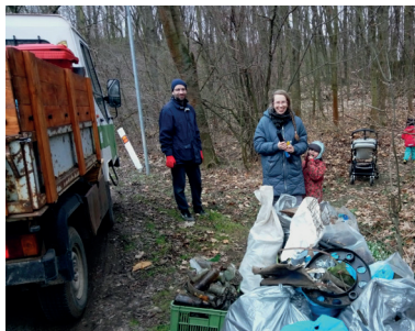
Úklid v Debrně