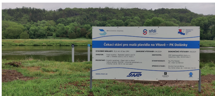
Čekací stanice pro malá plavidla

Z TISKOVÉ ZPRÁVY ŘEDITELSTVÍ VODNÍCH CEST ČR